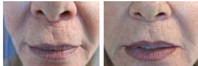
Vorher Nach 4 Behandlungen