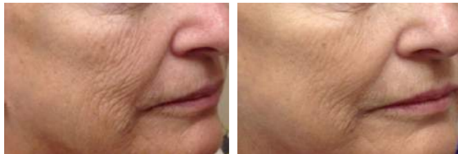
Vorher Nach 4 Behandlungen