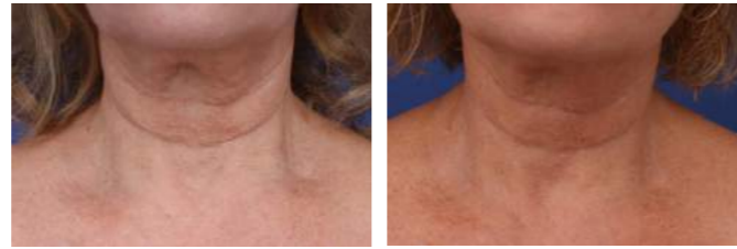
Vorher Nach 3 Behandlungen