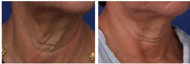
Vorher Nach 1 Behandlung