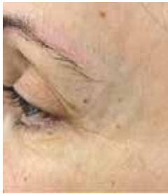
nach 3 Behandlungen