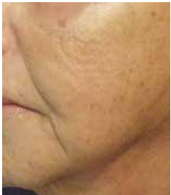
nach 3 Behandlungen