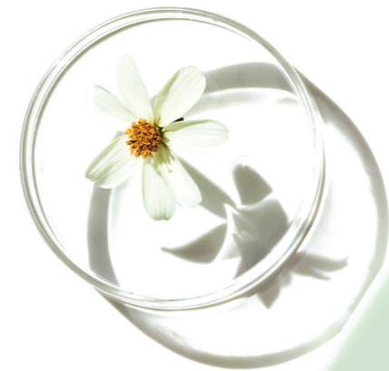
Der Geneo Revive OxyPod erfrischt fahle Haut, reduziert feine Linien und verbessert die Gesamtstruktur und das Aussehen der Haut.

Durch die Beschaffenheit der Kapseln wird gleichzeitig ein Peeling, ähnlich einer Mikrodermabrasion, durchgeführt, was die Haut durchlässiger macht und zusätzlich die Wirkstoffaufnahme fördert. Die Resultate sind verblüffend.