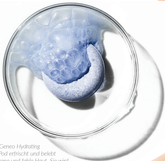
Der Geneo Hydrating OxyPod erfrischt und belebt trockene und fahle Haut. Sie wird mit Feuchtigkeit versorgt, strahlt und erhält neue Energie.

Die Forschungsabteilung von Pollogen blieb jedoch hier nicht stehen, sondern entwickelte eine ausgeklügelte, patentierte Technologie, welche es