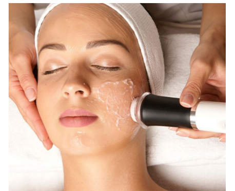
Die OxyGeneo™ «3in1»-Methode löst im Körper eine Reaktion aus, die vermehrt Sauerstoff in die behandelten Partien leitet. Gleichzeitig entfernt OxyGeneo™ abgestorbene Hautzellen und sorgt für ideale Bedingungen für das Einschleusen von wichtigen Wirkstoffen.

Es gibt ganz unterschiedliche Ultraschallgeräte in verschiedenen Anwendungsbereichen. Im Zuge der OxyPods-Entwicklung wurde zu jeder Behandlung ein hochkonzentriertes Serum mitentwickelt, um die Behandlungsergebnisse