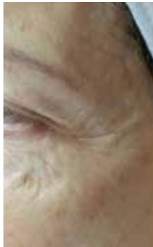
Nach der 1. Behandlung

«Wow, meine Haut sieht fantastisch aus und das nach nur einer geneo-Behandlung!»