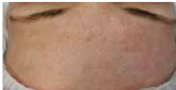
Nach der 1. Behandlung