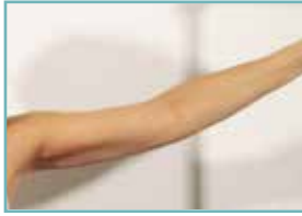
nach 6 Behandlungen